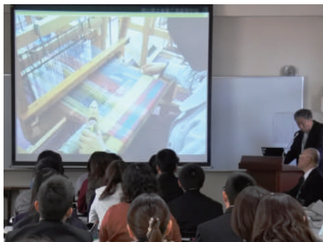
■専門科の授業について