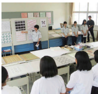
テキスタイル工学科