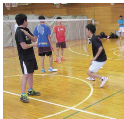
バドミントン部(部活動体験の一例)