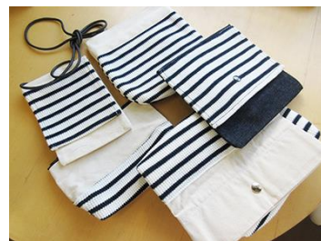
SDGs 企業からの端材を利用したポーチ