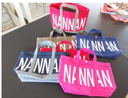
デニム・帆布の「NANNAN バッグ」